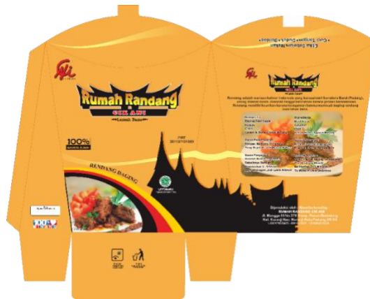
Gambar 3. Desain Kemasan Rumah Randang Cik Ani