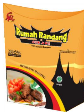
Gambar 4. Tampak Kemasan Rumah Randang Cik Ani