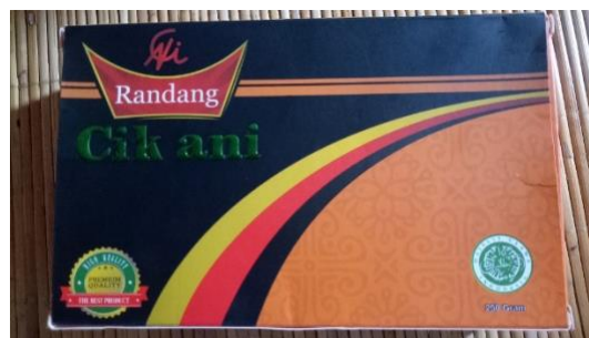
Gambar 1 : Rendang Cik Ani